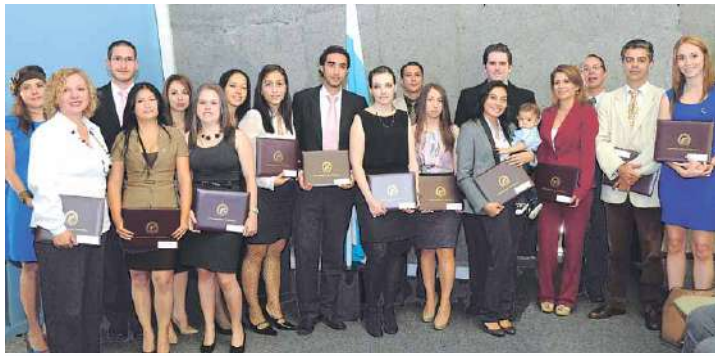
PROGRAMA DE POSGRADO EN DERECHO: Grupo de graduados de la Especialidad en Derecho Notarial y Registral.