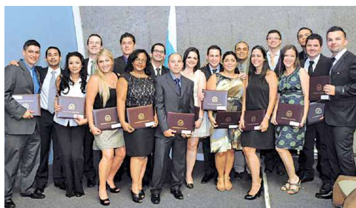
ESPECIALISTAS EN ANESTESIOLOGÍA Y RECUPERACIÓN: El SEP felicita a los 19 recién graduados de esta Especialidad.